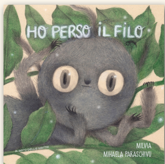
HO PERSO IL FILO MILVIA | MIHAELA PARASCHIV FORMATO 20x20cm | PAGINE 64 | €15

Un piccolo ragno sbadato ha perso il suo filo. Per ritrovarlo, chiederà aiuto alla lumaca, alla formica, al grillo, alla farfalla. Ma ognuno di loro ha altro da fare, seguendo la propria natura... e questo vale anche per la ranocchia, che di ragno va ghiotta! Solo allora, in un guizzo salvifico, il ragno ritrova il suo filo, e si fa portare lontano.