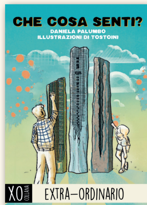
CHE COSA SENTI? DANIELA PALUMBO | TOSTOINI FORMATO 15x21cm | PAGINE 80 | €15

A San Sperate, in Sardegna, c'è il Giardino delle Pietre Sonore. E' la casa museo di Pinuccio Sciola, artista sardo che - come Geppetto con il legno - riconobbe la voce delle pietre. Esse diventarono protagoniste della sua arte scultorea. Il libro racconta questa intuizione di Sciola che diede vita al Giardino delle Pietre Sonore. Qui, migliaia di bambini, ogni anno, vanno ad ascoltare il canto delle rocce che l'artista ha intagliato per permettere l'ascolto del suono ancestrale che racchiude la voce della Natura. Ogni pietra un canto diverso, come differente è la storia che ogni pietra racconta.