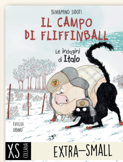
IL CAMPO DI FLIFFINBALL BENIAMINO SIDOTI | EVELISE OBINU FORMATO 13.8x18cm | PAGINE 88 | €15

TORNANO LE INDAGINI DI ITALO, L'INVESTIGATORE PIÙ PIGRO DELLA FATTORIA.