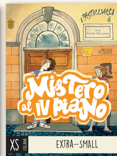
I PASTICCIACCI VOL. 1 MILVIA FORMATO 13.8x18cm | PAGINE 80 | €14,80

Nino e Simona, grazie all'esuberanza naturale dei loro 11 e 10 anni e ai guai che immancabilmente combinano, si ritrovano involontariamente coinvolti in situazioni inaspettate, inquietanti e misteriose. Non potranno quindi fare a meno di ficcare il naso e risolvere il caso in questione, spesso con la complicità del loro amico Edo.