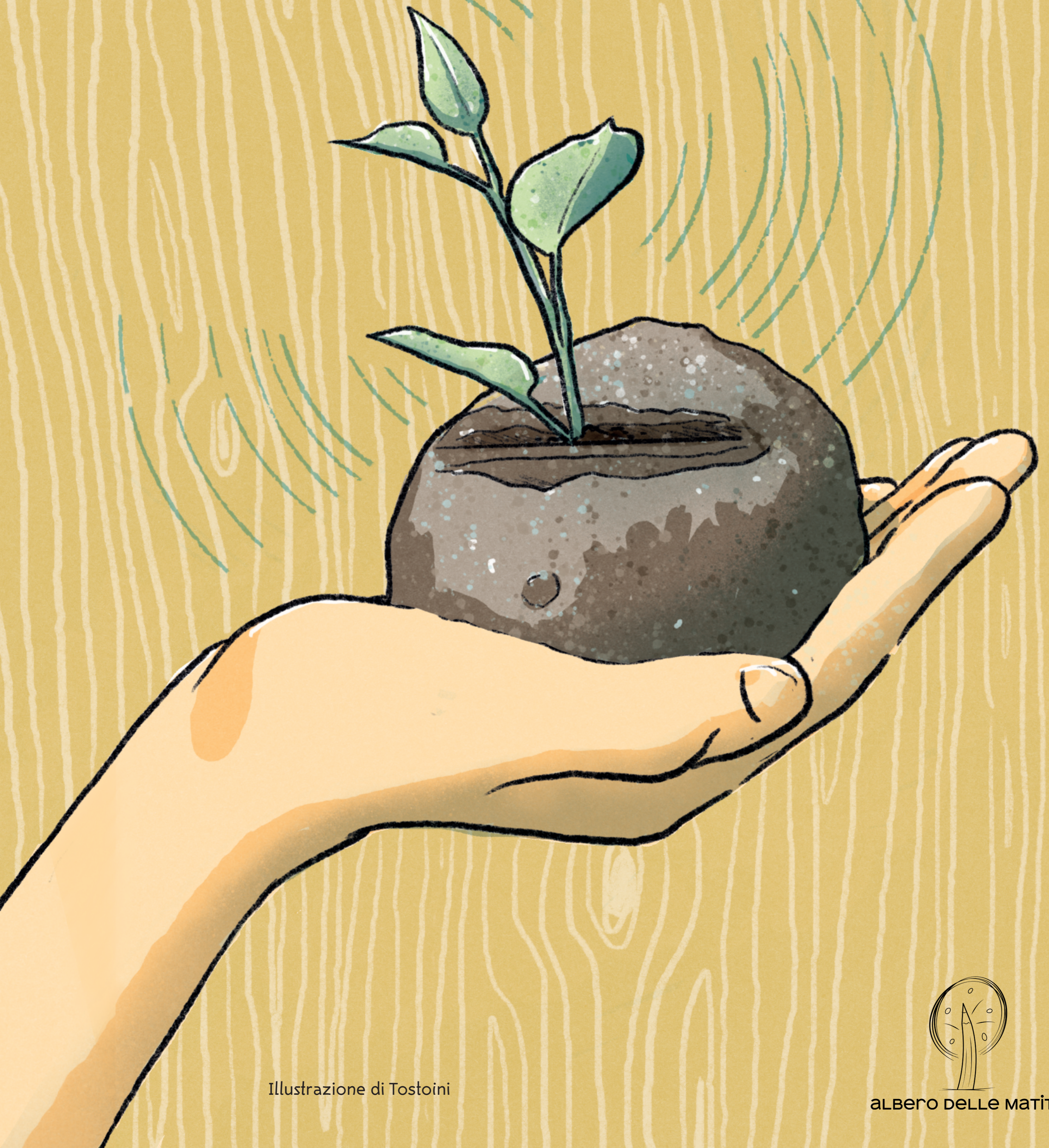
Illustrazione di Tostoini