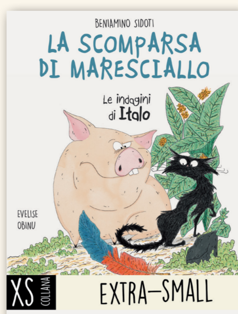
LA SCOMPARSA DI MARESCIALLO BENIAMINO SIDOTI | EVELISE OBINU FORMATO 13.8x18cm | PAGINE 88 | €15